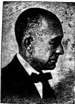
Manuel de Falla

naam "Spaanse dans" zeer bekend geworden. De Falla overleed in 1946 in Argentinië.